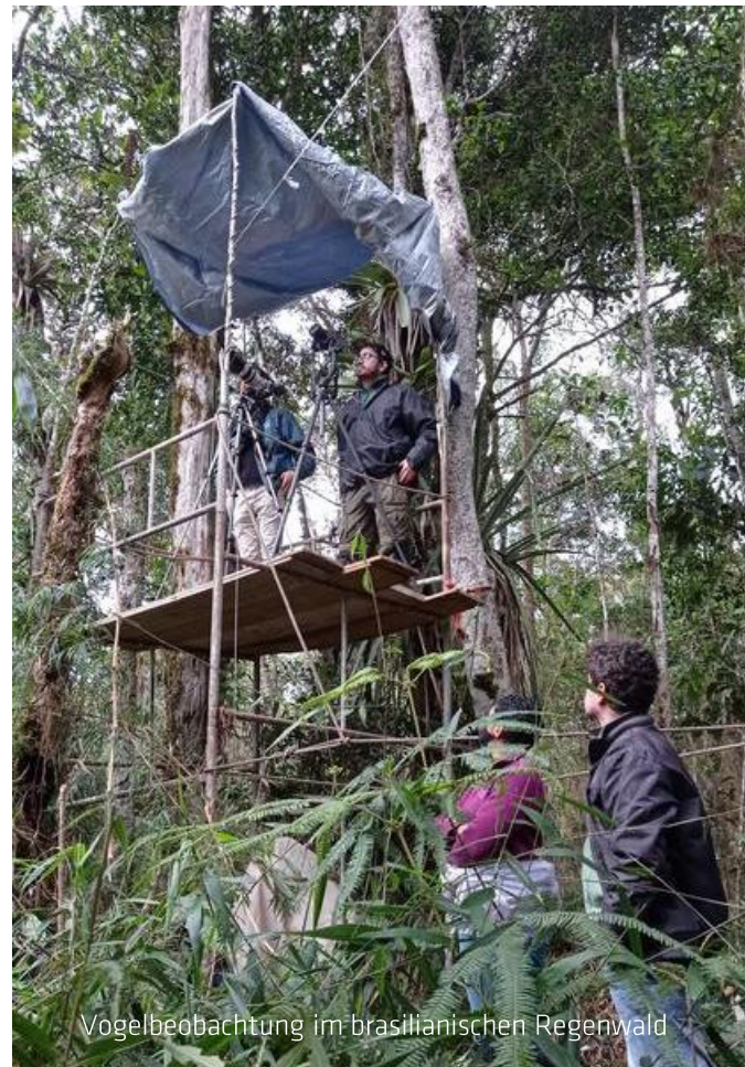
Vogelbeobachtung im brasilianischen Regenwald

Zum anderen werden biologische Daten über das Fortpflanzungs- und Fressverhalten gesammelt, um den langfristigen Schutz der Art zu verbessern. Im Dezember 2021 wurde vom Instituto Marcos Daniel ein 284 Hektar großes Schutzgebiet im Primärregenwald für die Rubinkehltangare eingerichtet. Dank der Fördermittel aus Hellabrunn und der Projektpartner konnten kürzlich vor Ort ein Biologe und ein Feldassistent eingestellt werden, die ab der kommenden Brutsaison für die tägliche Überwachung zuständig sein werden.